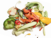
RESTES DE LÉGUMES (fanons, épluchures, pourris...)