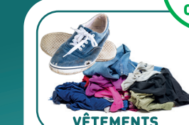
VÊTEMENTS LINGE DE MAISON CHAUSSURES

(propres et secs, dans un sac, chaussures liées par paires)