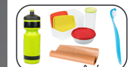
OBJETS ABÎMÉS EN PLASTIQUE OU EN MATÉRIAU COMPLEXE