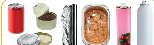
EMBALLAGES EN MÉTAL OU ALUMINIUM