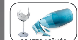
OBJETS ABÎMÉS EN VERRE