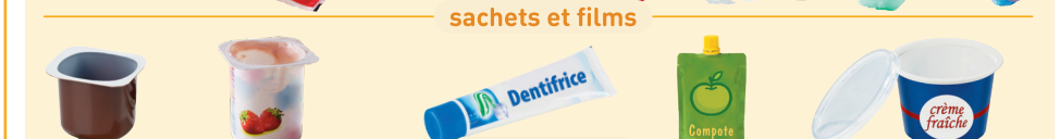
pots et tubes