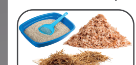
LITIÈRES D'ANIMAUX (végétale et minérale)