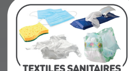
TEXTILES SANITAIRES (papiers essuie-tout, serviettes et mouchoirs en papier, lingettes, couches et protections hygiéniques...)

TOUT CE QUI EST TRÈS PETIT (petits opercules d'emballage, bouchons...)