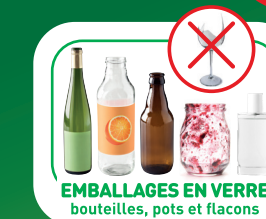
EMBALLAGES EN VERRE bouteilles, pots et flacons