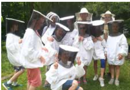
RUCHER ECOLE : sensibilisation des enfants à la défense des abeilles

► apiculture : Le rucher-école est mis à disposition du syndicat des apiculteurs : formation et sensibilisation à l'apiculture, accueil des classes primaires de la ville.