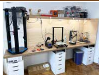
Les nouveaux espaces dédiés à l'impression 3D

Afin de répondre à la demande croissante et d'assurer son développement, Ribolab aménage un nouveau local qui va permettre de doubler la surface disponible. Les différentes activités pourront ainsi être pratiquées sans gêner mutuellement.