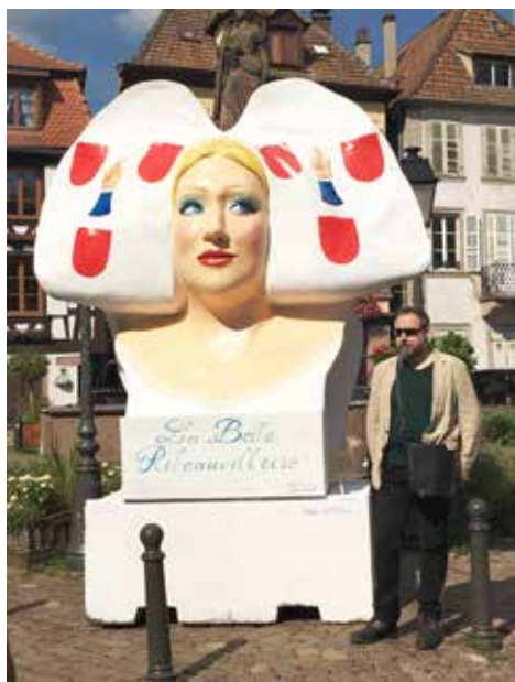
Aussi belle de face que de dos «La Belle Ribeauvilloise» d'Antoine Helbert !