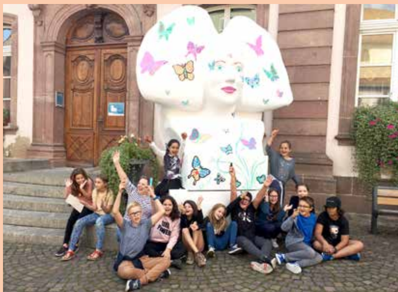
Des papillons à foison pour l'Alsacienne confiée aux petits conseillers !

Elles ont été exposées la première fois en 2008 à l'occasion du centenaire du Musée Alsacien et de la rénovation du Musée Historique de Strasbourg, capitale de l'Alsace. À Ribeauvillé, capitale des Ménétriers d'Alsace, elles retrouvent une deuxième jeunesse et participent au rayonnement de notre commune.