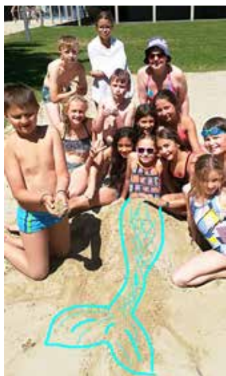
Une sirène à Carola...