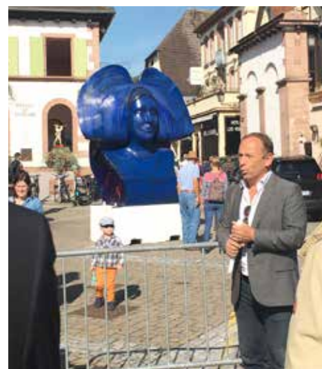
L'Oeuvre de Raymond E. WAYDELICH «La Ligne Bleue des Vosges», en début de parcours, présentée par Christophe FLEUROV, commissaire de l'exposition

Jusqu'au 30 septembre prochain dix bustes monumentaux à l'effigie d'une Alsacienne ont pris possession de quelques places emblématiques de notre cité.