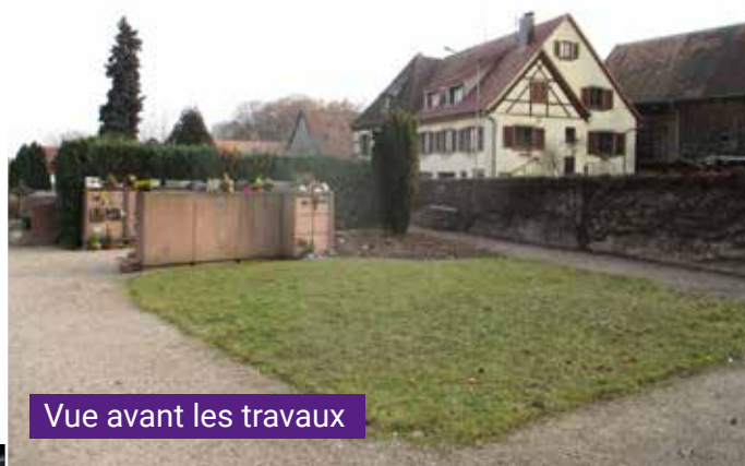
Vue avant les travaux