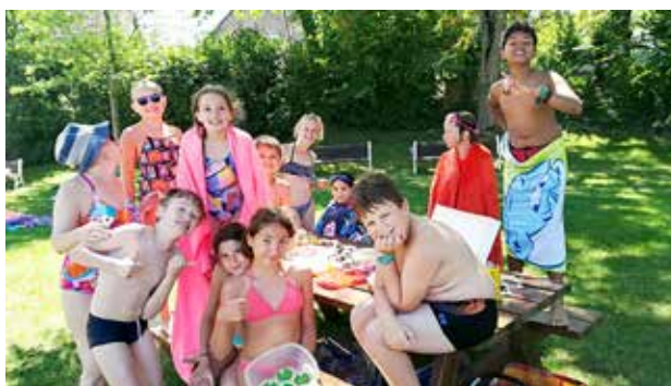
Mmmhh les bons goûters! Merci les mamans!