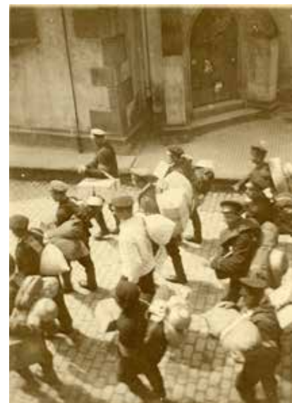
Départ de Ribeaupillé de conscrits devant la chapelle Sainte Catherine

Ribeauvillois (leurs différentes affectations et combats auxquels ils ont participé, présentation de leurs régiments et de leurs uniformes...). On pourra voir de nombreuses photos inédites, documents originaux et souvenirs des combattants de notre cité. Cette présentation – à partir du parcours des combattants ribeauvillois, ancêtre de familles que nous connaissons tous – permettra de mettre en lumière un aspect souvent oublié et/ou méconnu de ce conflit : d'une part son aspect « mondial » qui dépasse largement le continent européen ; et, d'autre part, que ce conflit, souvent présenté comme une « guerre de position » a, en fait, été une « guerre de mouvement » pour les régiments et pour les hommes.