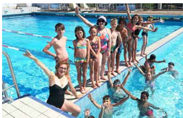
« Vive le bleu! »

Pour certains c'est la fin d'une première année de mandat, pour les autres c'est le départ vers d'autres horizons notamment l'entrée en 6 ème . Au cours des deux années d'investissement que demande le Conseil Municipal des Enfants, des liens se sont tissés, des idées ont été échangées mais pour nous tous, l'envie de faire demeure.