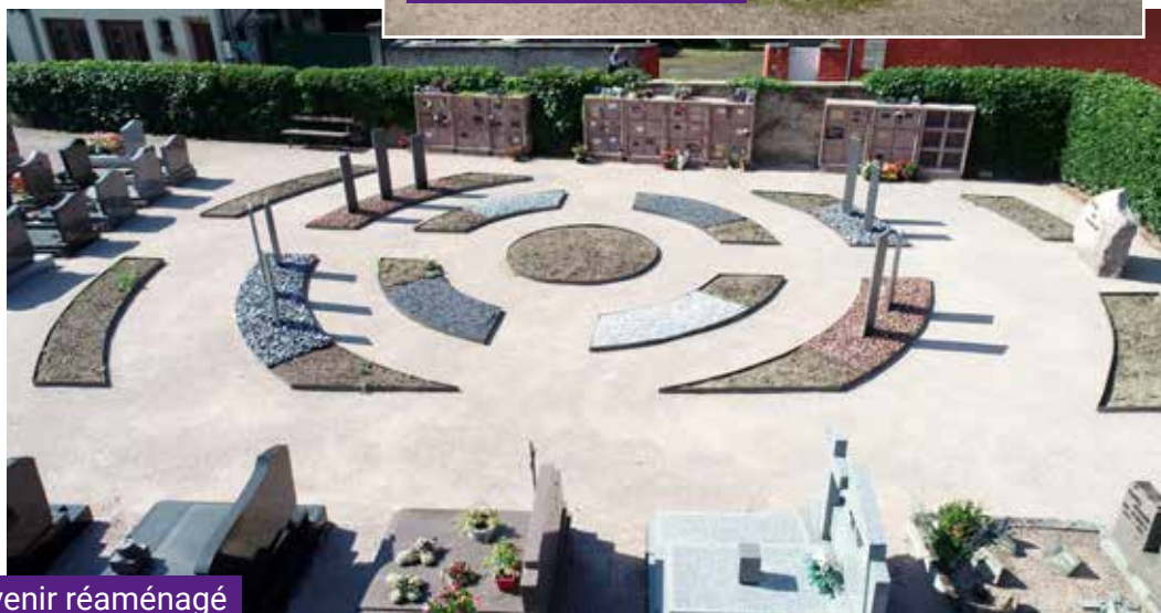
Le Jardin du Souvenir réaménagé