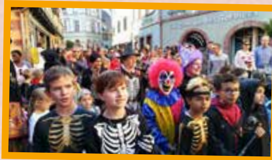
Un peu de frayeur, mais beaucoup de bonbons! Cooooool Halloween...