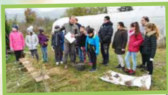
Plantation d'une haie vive au Jardin Partagé avec les bénévoles de l'association Sillons Sème.