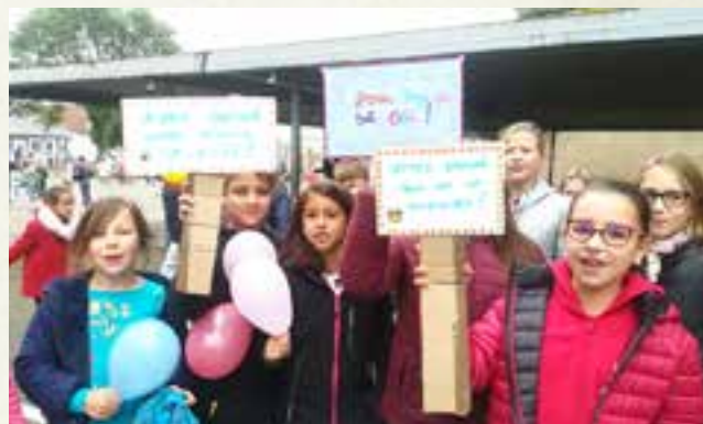
...et à l'Ecole Spaeth

Après l'explication du fonctionnement du CME dans les écoles élémentaires, les déclarations de candidatures ont abouti aux opérations de vote ! ... une véritable leçon d'instruction civique !