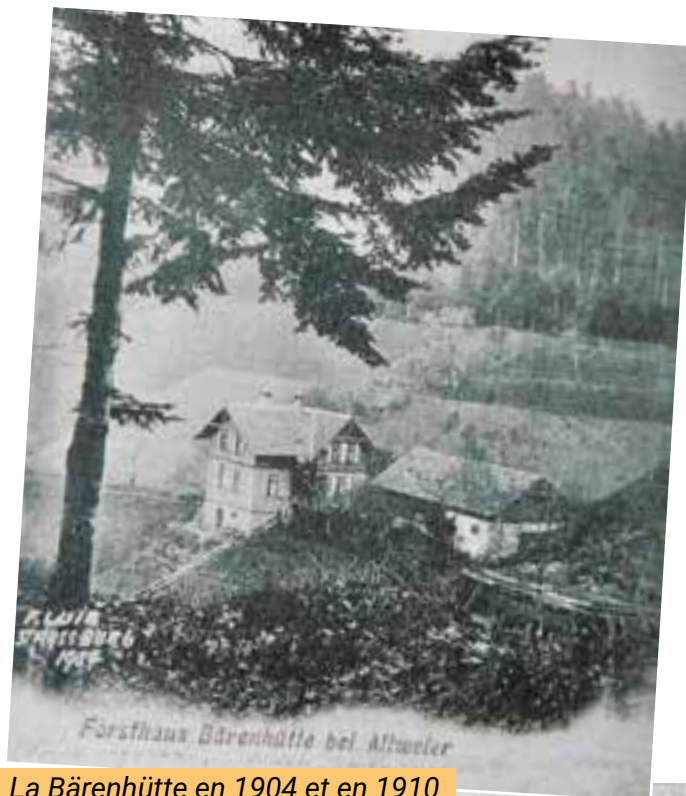
La Bärenhütte en 1904 et en 1910