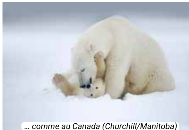
... comme au Canada (Churchill/Manitoba)