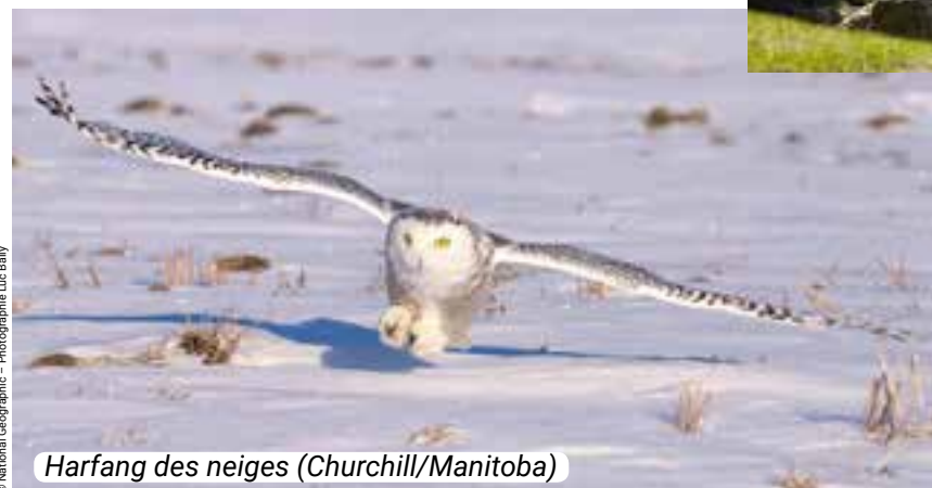
Harfang des neiges (Churchill/Manitoba)