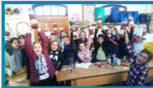
Écouter, regarder, apprendre, goûter, hmmm! Quel bel après-midi avec les Äpfelbisser !

Nous déplacer sur les sites de mémoire est important pour nous afin que nous comprenions mieux les tourments de la guerre, en l'occur- rence celle de 14-18. Notre sortie au Mémorial du Linge nous a beaucoup appris!