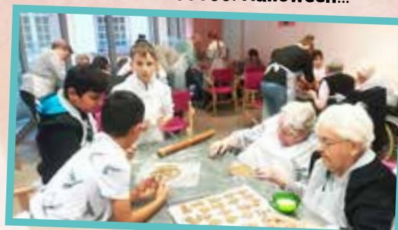
Des bredalas pour le Marché de Noël de la maison de retraite!