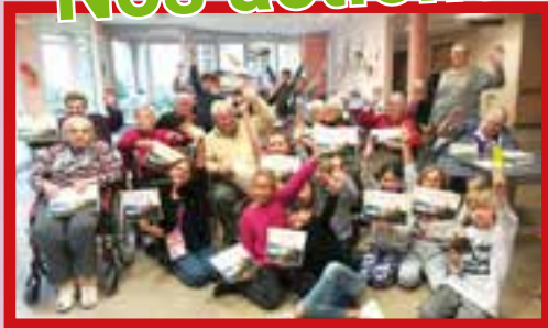
Tournoi sportif à la Maison de retraite : chouette, tous les sportifs ont obtenu leur diplôme!