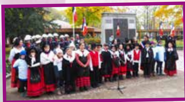
La cérémonie du 11 Novembre en costume alsacien pour rendre hommage aux anciens combattants