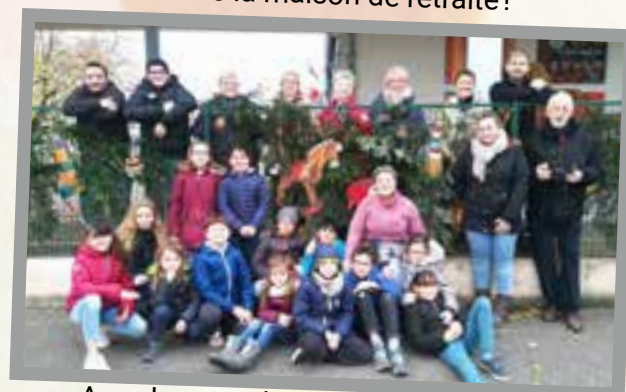
Avec les membres de la Commission Fleurissement, décoration de nos écoles!