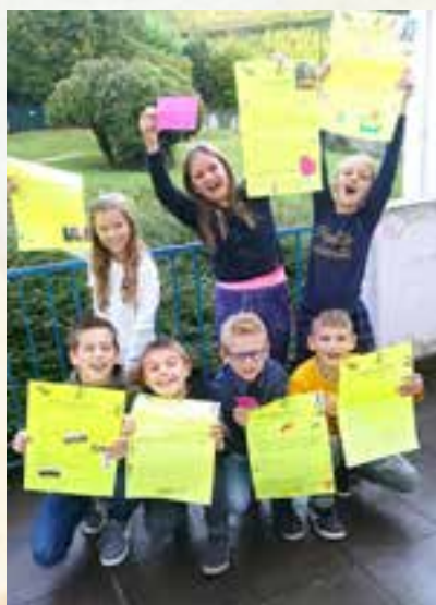
À l'Ecole Primaire Ste Marie...

Après l'explication du fonctionnement du CME dans les écoles élémentaires, les déclarations de candidatures ont abouti aux opérations de vote ! ... une véritable leçon d'instruction civique !