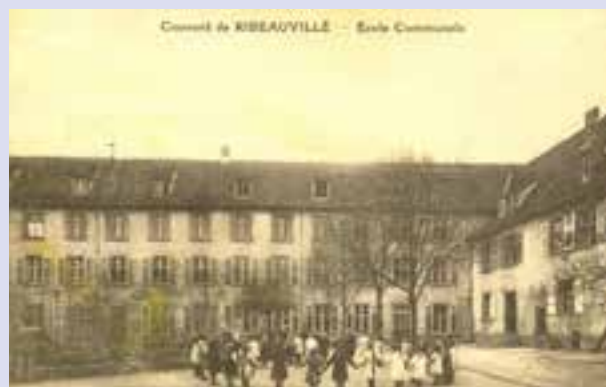
« L'école des filles en 1925 »

Propriété d'une famille noble vassale des Ribeaupierre au début du 16 ème siècle, la grande résidence avec parc construite par les Truchsess de Rheinfelden est vendue comme bien national à la Révolution. En 1796, l'instituteur Benjamin Ortlieb y ouvre une école d'enseignement supérieur et un pensionnat pour jeunes gens qui dispensent une pédagogie novatrice, réputée dans tout l'est de la France. En 1850, ce sont les sœurs de la Divine Providence qui achètent les bâtiments et créent une école expérimentale pour instruire et éduquer les jeunes filles. Une école ménagère et une école maternelle la compléteront rapidement. Avec la construction de l'école maternelle du Rotenberg et le regroupement des écoles primaires au sein du groupe scolaire René Spaeth à la rentrée 1977 la vie pédagogique se retire de cette institution éducative phare qui a perduré pendant près de deux siècles.