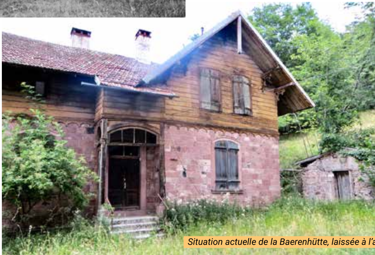
Situation actuelle de la Baerenhütte, laissée à l'abandon.

Ne serait-il pas possible de redonner vie à ce coin de paradis ?