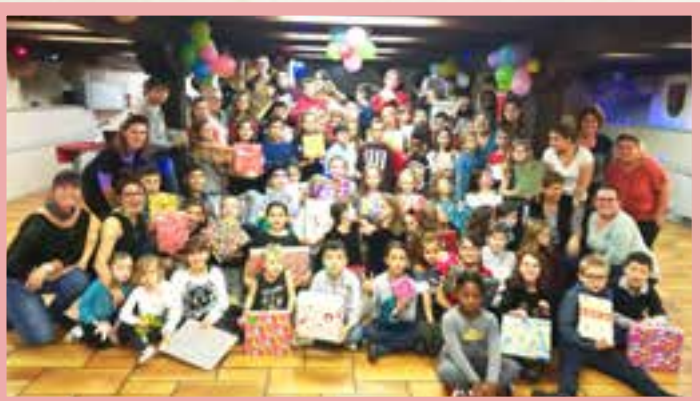
Boum et solidarité : avec l'esprit de Noël, deux actions qui nous conviennent bien!