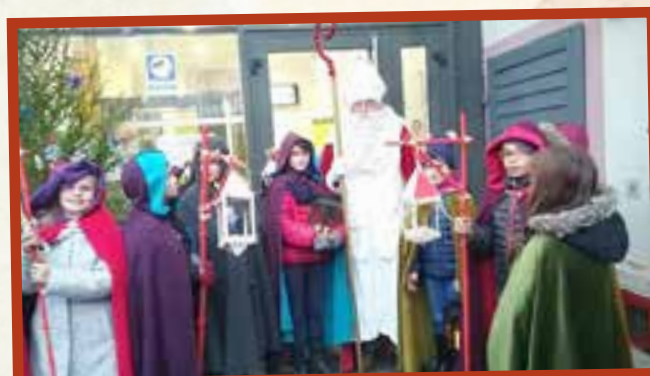
Et encore une histoire qui se termine bien: vive Saint Nicolas !