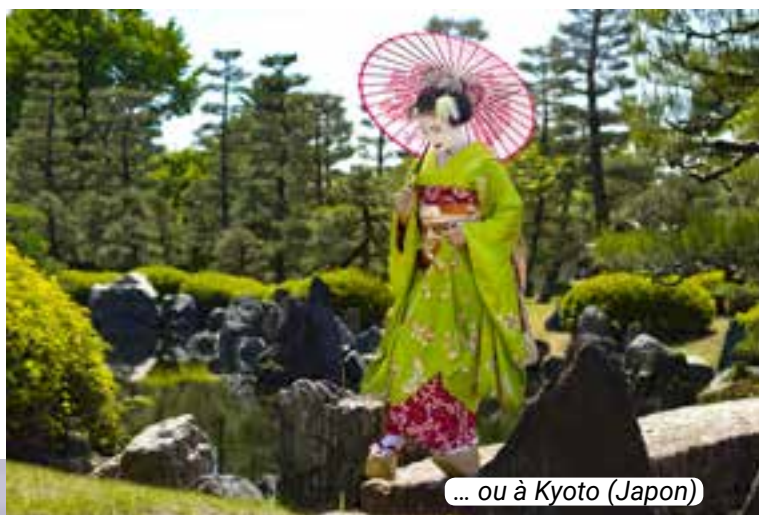
... ou à Kyoto (Japon)