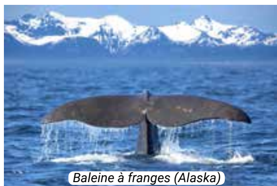
Baleine à franges (Alaska)