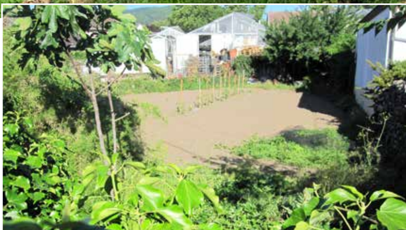
Un des derniers jardins révolutionnaires de Ribeauvillé, rue de Landau

Ces droits ont disparu avec le développement de la propriété privée et du libéralisme économique.