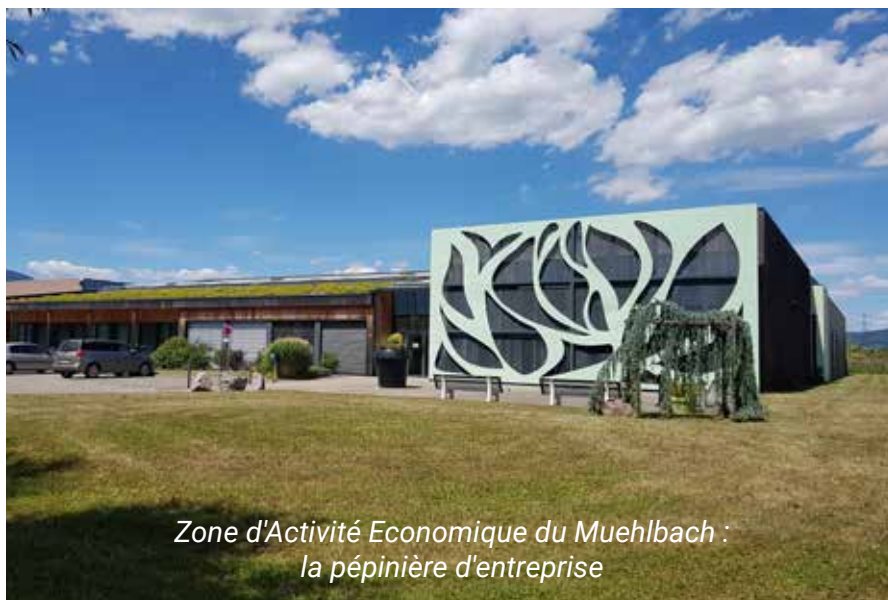
Zone d'Activité Economique du Muehlbach : la pépinière d'entreprise

Cette volonté se traduit aussi par une dynamique renouvelée dans tous les secteurs économiques. Le soutien à l'emploi et aux activités de nos entreprises sera au cœur de nos démarches. Une juste répartition de nos ressources au bénéfice de tous constituera l'assurance d'un cadre de vie équilibré.