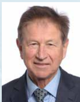
CHRIST Jean-Louis Maire de Ribeaupvillé