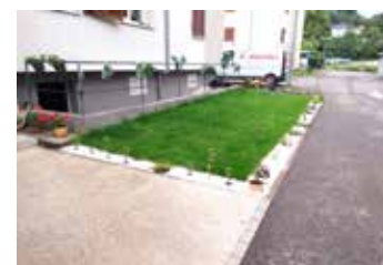
Une initiative collective des locataires des Mirabelliers pendant le confinement : la création d'espaces verts et fleuris.