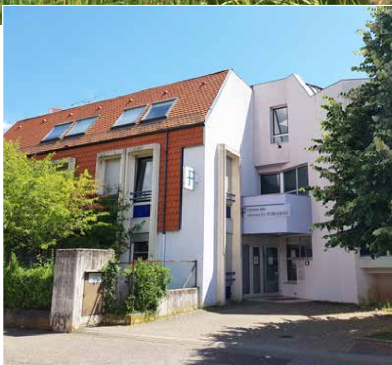
Le Centre des Finances publiques (Trésorerie) : futur siège de la Communauté de Communes du Pays de Ribeaupillé.