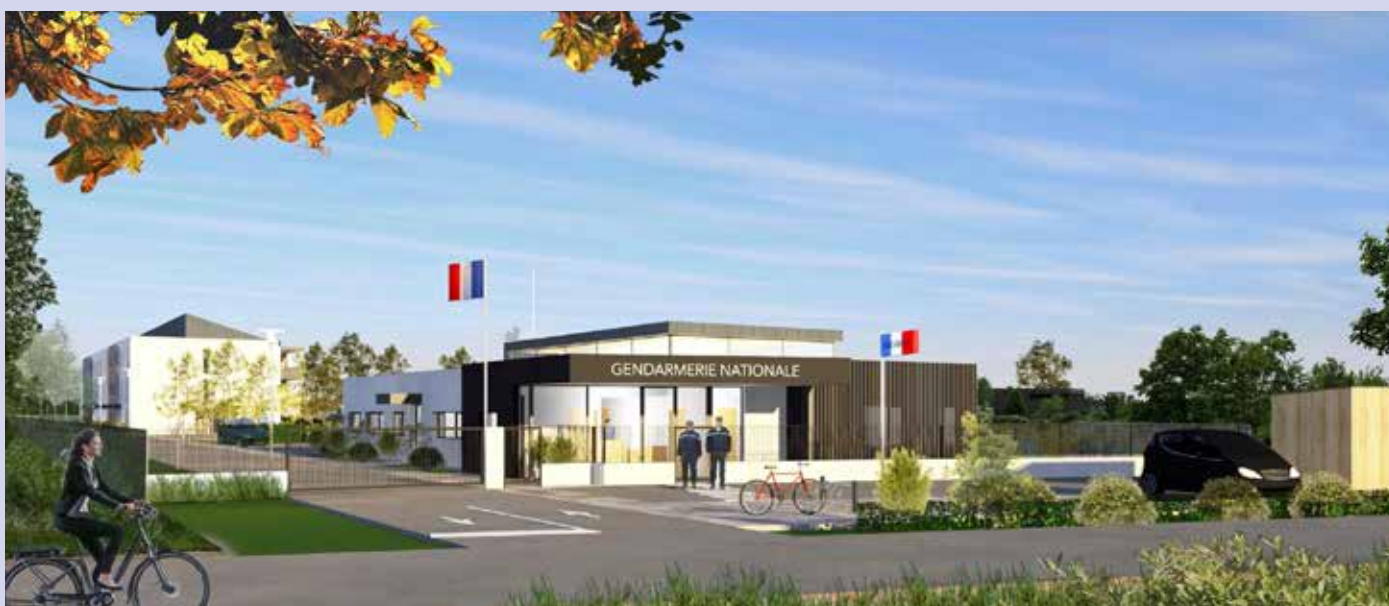
PERSPECTIVE EXTÉRIEURE SUR RUE