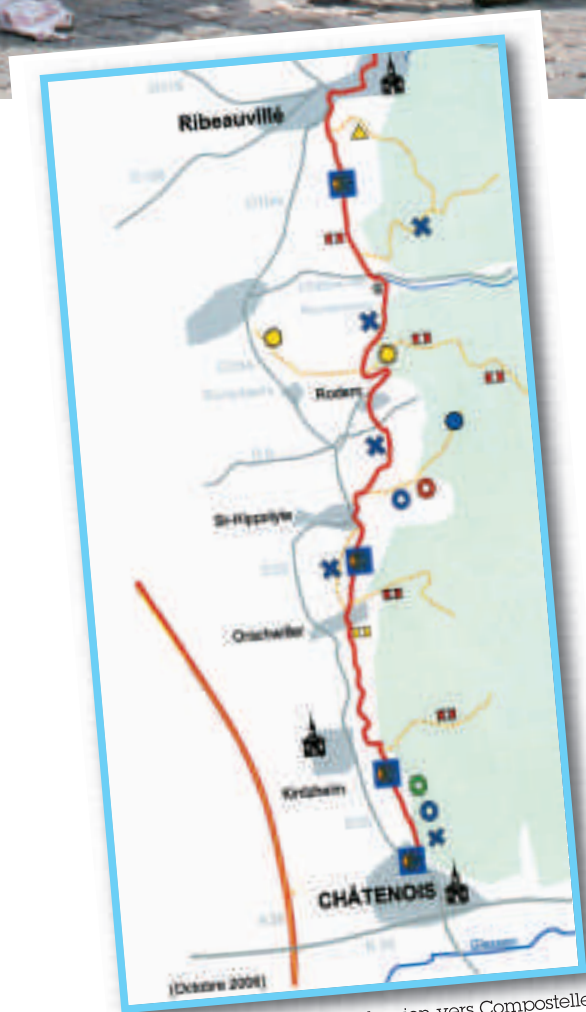
Le chemin alsacien vers Compostelle : étape 7 de Châtenois à Kaysersberg