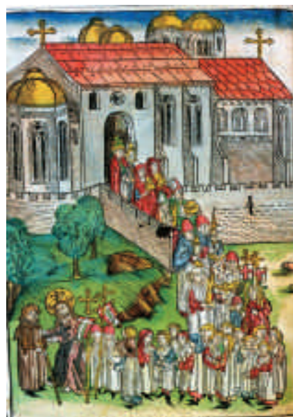
13 e siècle: la plus ancienne représentation du pèlerinage à St Jacques de Compostelle

Depuis le IX ème siècle, des milliers de gens marchent vers un petit sanctuaire situé à l'extrême nord-ouest de l'Espagne. C'est dans le «campus stella», le champ des étoiles ou Compostela, que reposerait le corps de l'apôtre St Jacques, dont le tombeau fut découvert en 810. Cette découverte tombe au bon moment car la chrétienté cherche à reconquérir l'Espagne occupée par les Sarrasins. Saint Jacques apparaît même en rêve à l'empereur Charlemagne et lui ordonne de reprendre les terres conquises par les musulmans. A l'école nous avons appris cet épisode, marqué par le courage de Roland à Roncevaux.